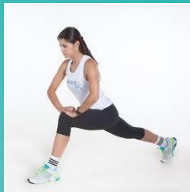
Mobilidade quadril (realizar o dois lados)