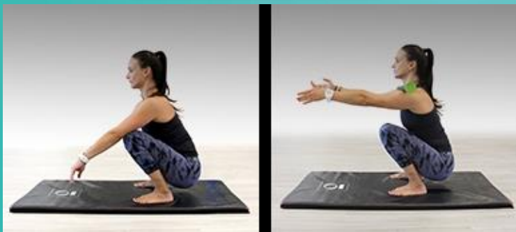
Mobilidade membro inferior (Cócoras)