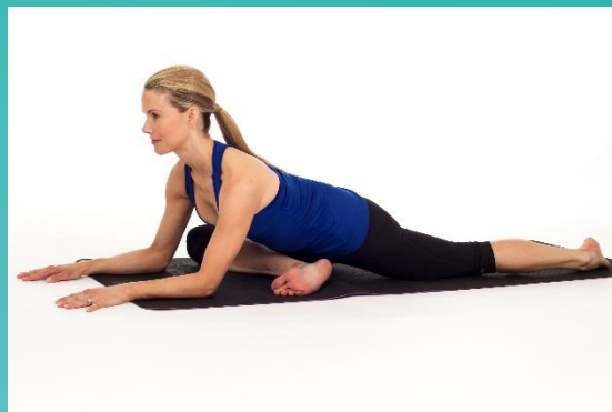
Mobilidade membro inferior e tronco