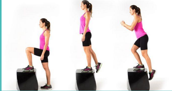
SOBE E DESCE NO BANCO