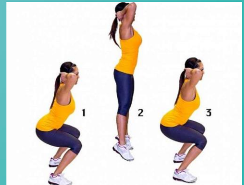
AGACHAMENTO COM SALTOS